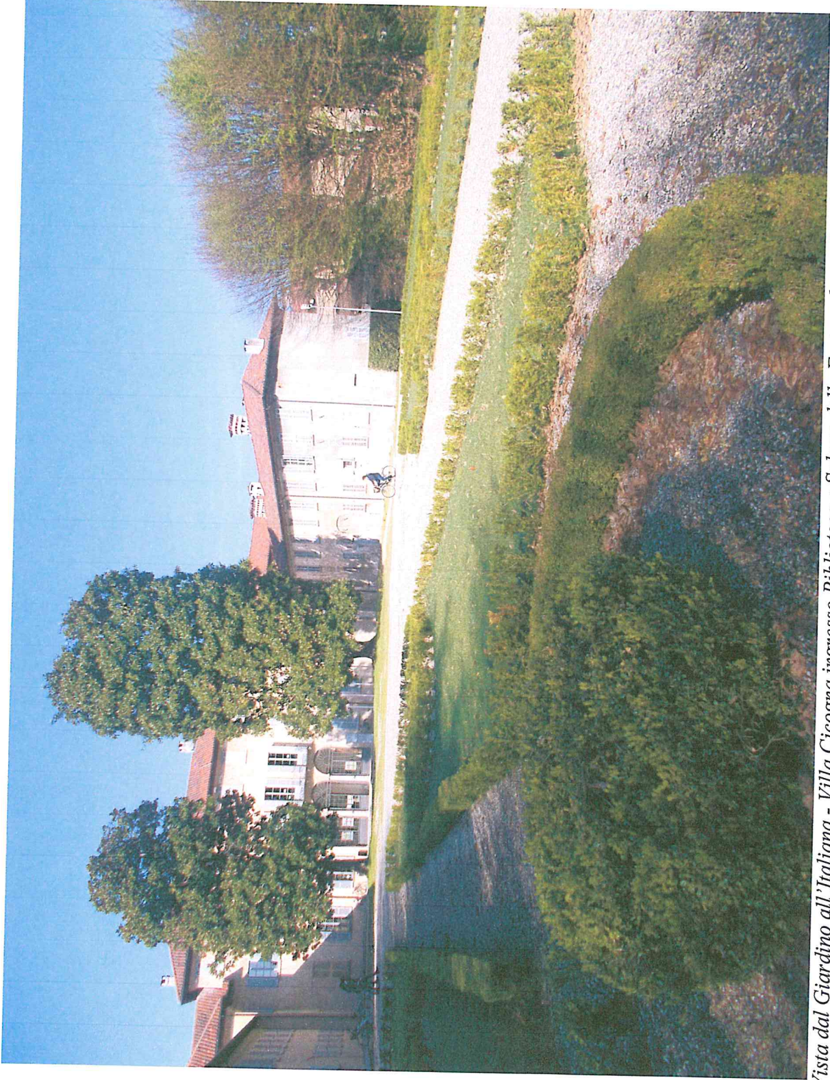
Vista dal Giardino all'Italiana - Villa Cicogna ingresso Biblioteca e Salone delle Feste a destra locali oggetto di intervento